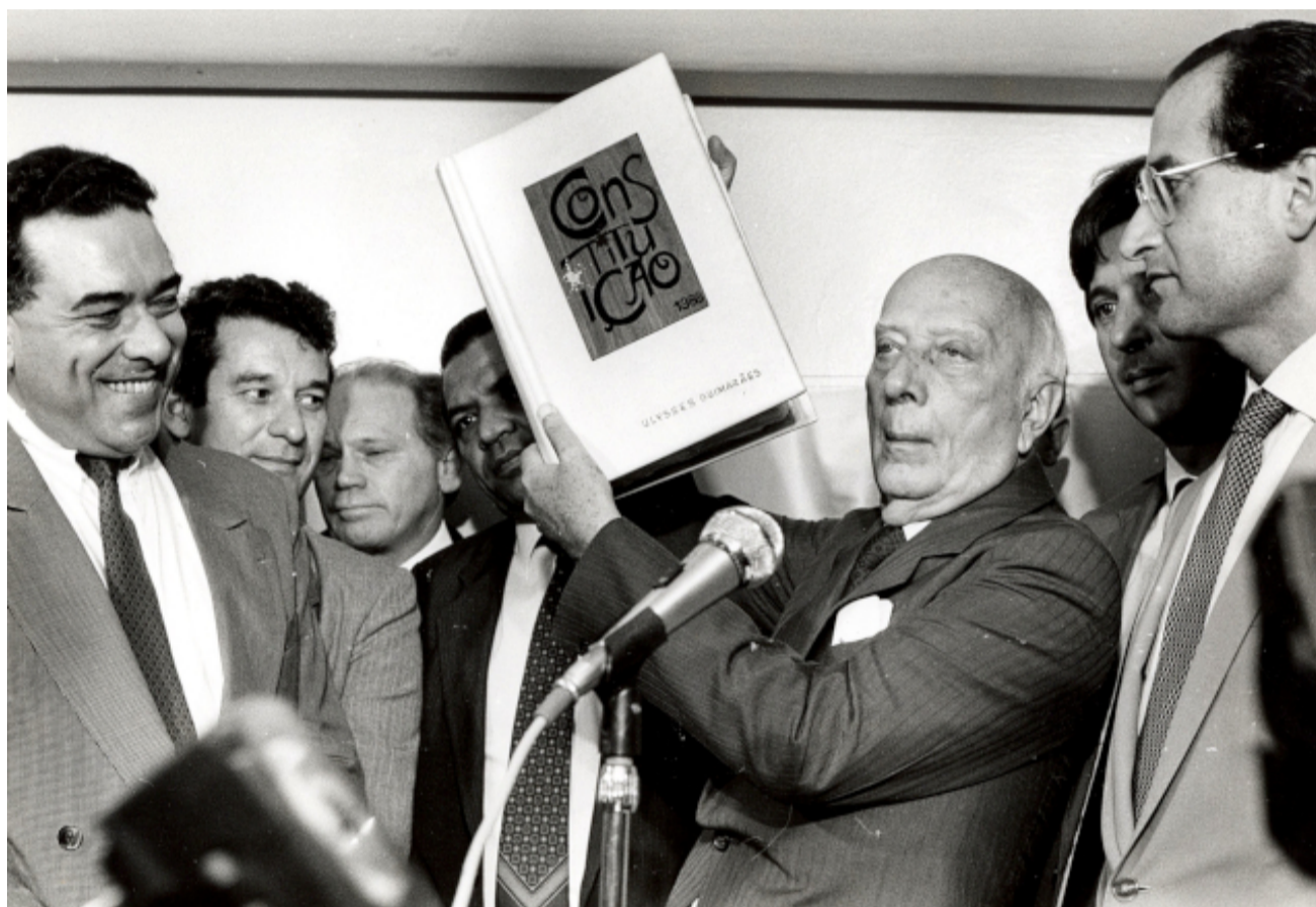
Presidente da Assembleia Nacional Constituinte, deputado Ulysses Guimarães apresenta a Constituição Federal de 1988, a Constituição Cidadã.

Por Laurisa Farias, Luísa de Pinho Valle