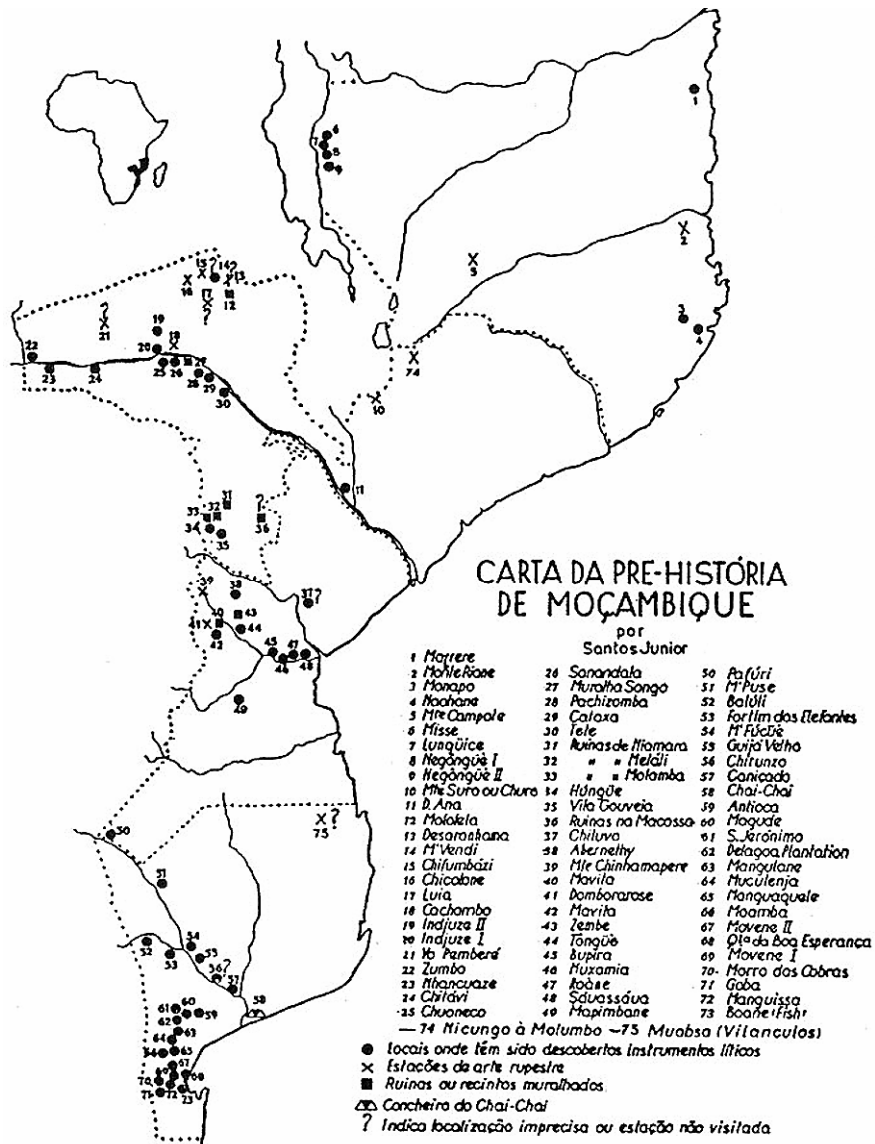
Fig. 1. - Carta da Pré-História de Moçambique

Nesta perspectiva, um trabalho criterioso de inventário poderá constituir um instrumento precioso não só para o seu conhecimento, como também para a recuperação do que muitas vezes se perdeu ou se pensa subsistir apenas em memórias que o tempo não perdoa.