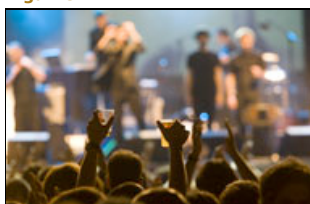
SOL no Festival Med