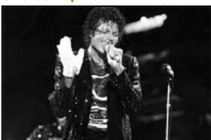
Morreu Michael Jackson