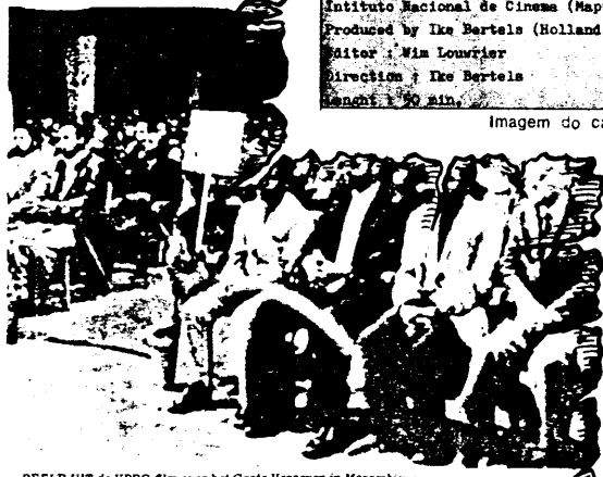
BEELD UIT DE VPRO-film over het Grote Vergeven in Mozambique.

In de hoofdstad Maputo moest ik wachten op een pasje om de voormalige bezette gebieden te kunnen bezoeken. In de ruim 1500 kilometer ver liggende nooraaijke provincie, ik was gewaarzocht dat ik zou geïdentificeerd, stempels en handtekeningen nodig had, en dat die niet een, twee, drie zouden worden afgegeven, ook in Mozambique had de bureaucratie toegeslagen.