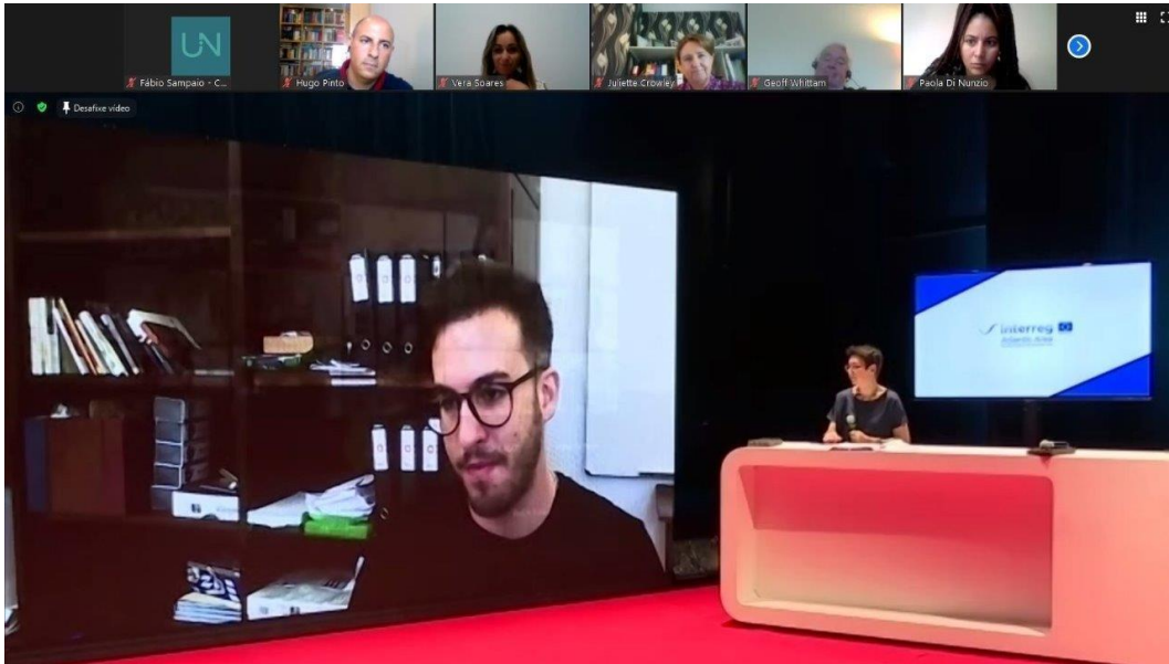
Foto 6: A inovação social é fundamental e tornou-se ainda mais importante no contexto atual de Pandemia