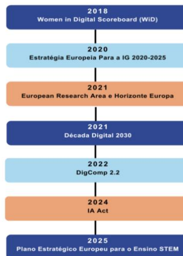
Figura 1 - Linha do tempo dos principais normativos europeus

violência e discriminação online , responsabilização das plataformas (DSA).