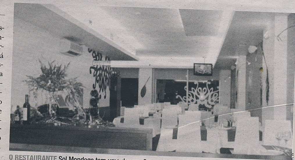
O RESTAURANTE Sol Mondego tem uma decoração moderna