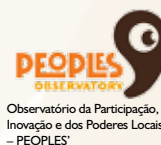
Observatório da Participação, da Inovação e dos Poderes Locais - PEOPLES'

O PEOPLES' dedicou o último trimestre à construção do novo website, concentrando a atenção sobretudo na secção multimédia, que vai contribuir para a próxima edição do Festival “Democracine” a realizar em Porto Alegre em Maio de 2011. Neste período, o Observatório entrou na Rede Nacional de Agricultura Urbana Portuguesa, tornando-se parte dos grupos “Planeamento” e “Educação e Cidadania” e – através do projecto “Optar” – começou a trabalhar na avaliação das percepções do público sobre o Orçamento Participativo de Lisboa e na organização do OP Jovem da Câmara da Trofa. Os seus representantes também participaram em vários seminários internacionais (Ecocities em Montreal, ECPR em Reykjavik, formações sobre orçamento participativo em Rabat, Marrocos e Pietermaritzburg, África do Sul), e na organização do Estágio de Verão Ciência Viva no CES, intitulado “Cidade e participação cidadã”.