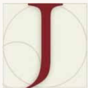
Observatório Permanente da Justiça Portuguesa

Destacamos, em primeiro lugar, a conclusão do estudo “O sistema judicial e os desafios da complexidade social. Novos caminhos para o recrutamento e a formação dos magistrados”, apresentado publicamente em Maio último. Este estudo tinha como objecto central a avaliação das políticas e do modelo de recrutamento e formação de magistrados em Portugal e a apresentação de uma proposta de reforma. À luz da investigação realizada e das linhas orientadoras definidas, apresentámos um conjunto de recomendações para a construção de um novo sistema de recrutamento e de formação de magistrados em Portugal que, se devidamente aplicado, permitirá mudar o paradigma desta política pública. No que diz respeito às actividades de formação, decorreram dois cursos de formação subordinados aos temas “Sistema penitenciário: Entre a segurança e a reinserção. O novo regime legal da execução das penas privativas de liberdade” e “A sociedade de risco e a reparação dos danos”, em Fevereiro e Junho, respectivamente. Destaca-se, ainda, a realização da Conferência “O processo penal nos EUA e em Portugal: contrastes e desafios”, em parceria com a Procuradoria-Geral Distrital e o Tribunal da Relação de Coimbra, tendo como conferencista o Juiz Federal do Estado de Maryland, Peter J. Messitte.